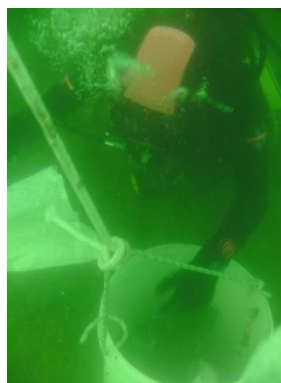
Ascensore per rifiuti