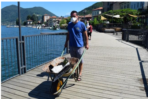
Verso lo smaltimento

Alcune immagini da precedenti edizioni. Per foto in alta risoluzione, video, interviste o altre informazioni potete contattare l'Ufficio Stampa di GODiving: Guidalberto Gagliardi, guido@godiving.it