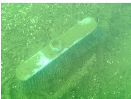
Un curioso rifiuto sommerso