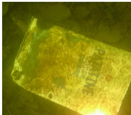
Un segno d'inciviltà