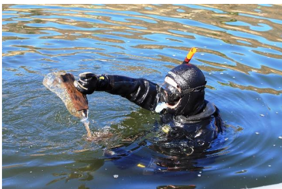
Una bottiglia in meno nel lago