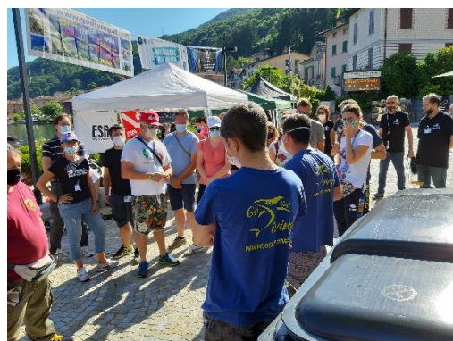
Alcuni volontari a BLU PULITO 2020