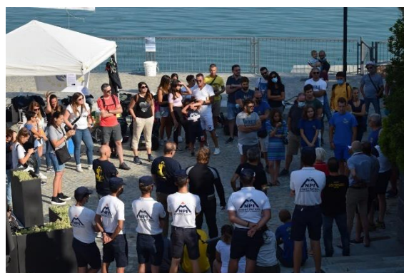
Il briefing pre-immersione